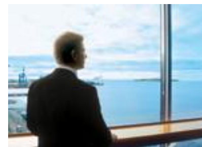
Viennin rahoitus ja Suomen Vienti- luotto Oy