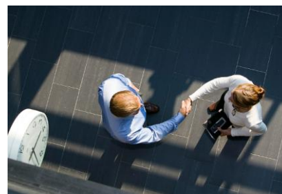
Kasvu ja kansainvälistymisrahoitus